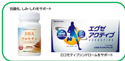
ライオン(株) 知財シーズを活用した商品