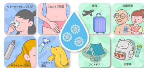
様々な製品に応用できます 水を使えないシーンに ロート製薬(株) 肌に優しいクレンジング技術ミセラウォーター