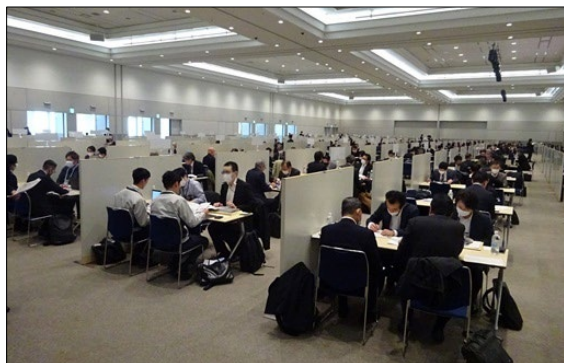
令和5年度に実施した「九都県市合同商談会2024」の商談風景 (会場: パシフィコ横浜 アネックスホール)

首都圏産業の国際競争力の強化を図るため、平成20年度から九都県市(埼玉県、千葉県、東京都、神奈川県、横浜市、川崎市、千葉市、さいたま市、相模原市)が連携して合同商談会を開催し、今回で17回目を迎えます。